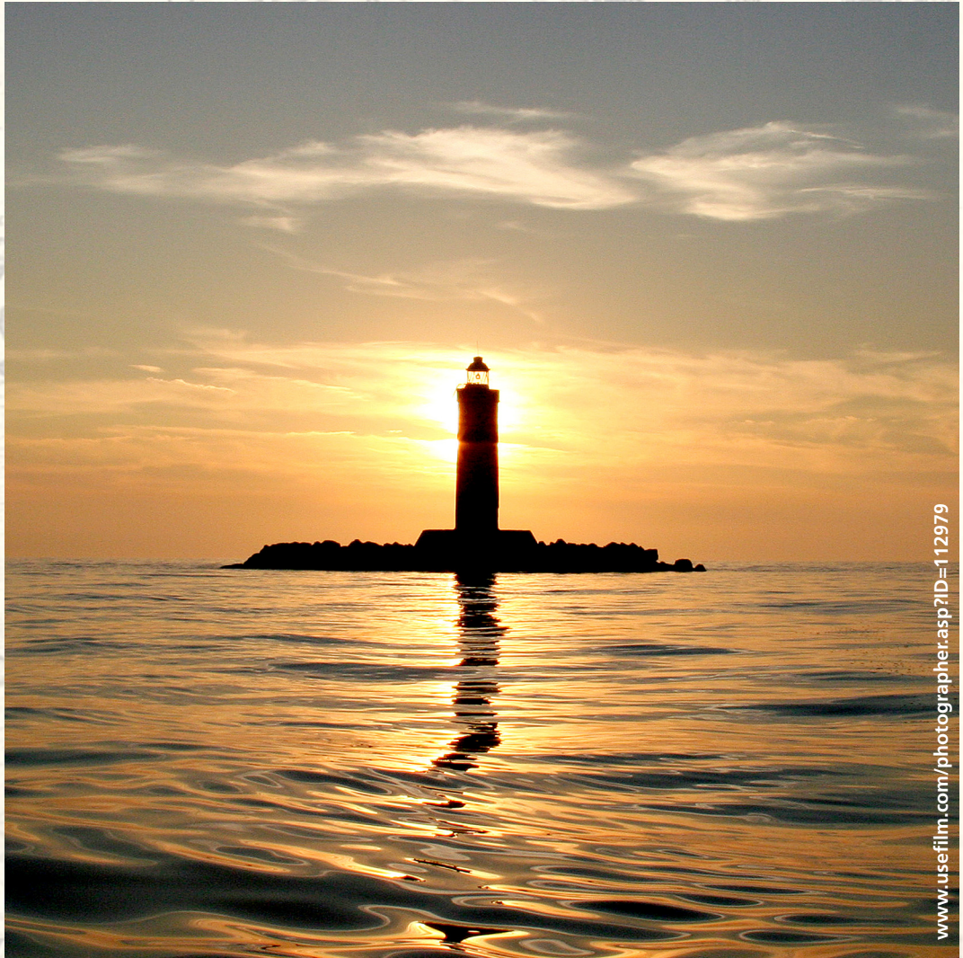
"Il fanale di Vada" - photo Marco Diquattro

www.usefilm.com/photographer.asp?ID=112979